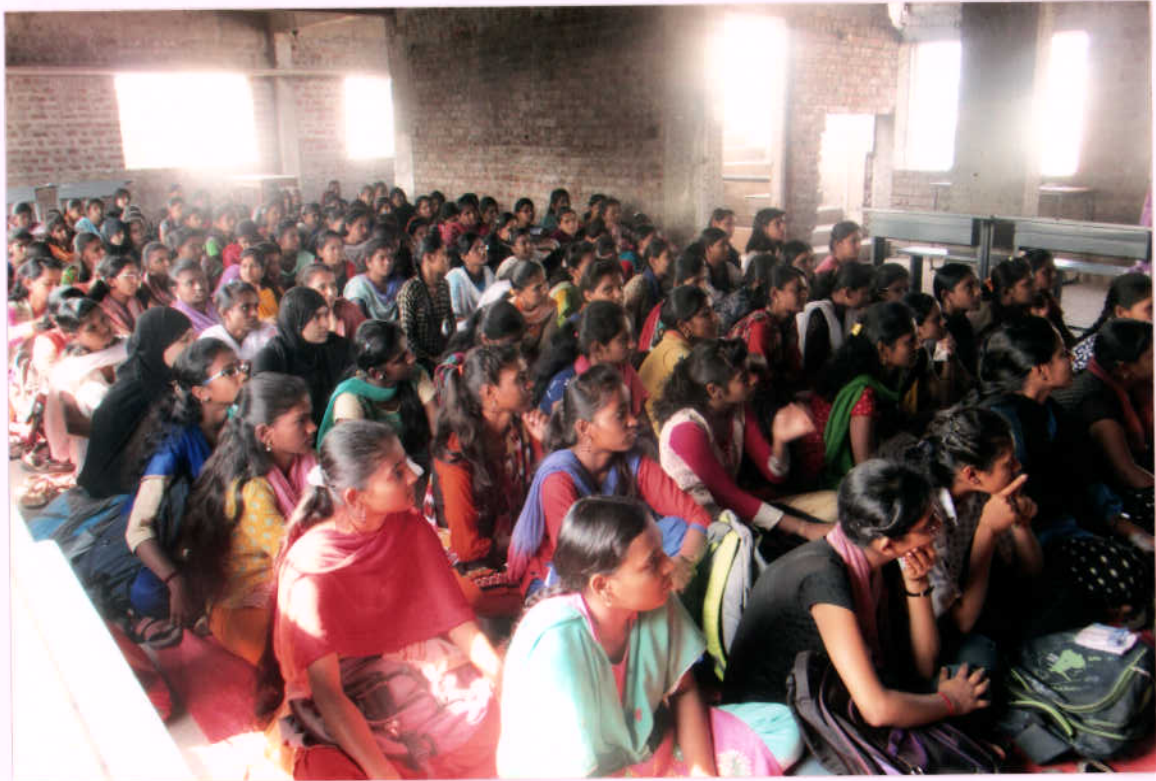
उपरिचयत विद्यार्थिनी टिमो ग्लोबीन व वलड भुपचे महत्य जाणून घेताना