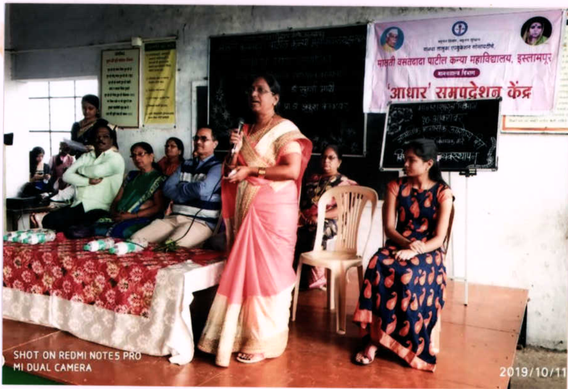
जागतिक आणविक सारोग्य दिन मर्मा संभोजक जागण करणा।