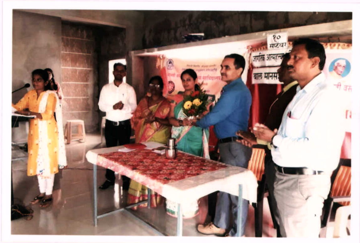
जगतीक आमहत्या प्राग्विशनि दिग - स्वागत करणाग।