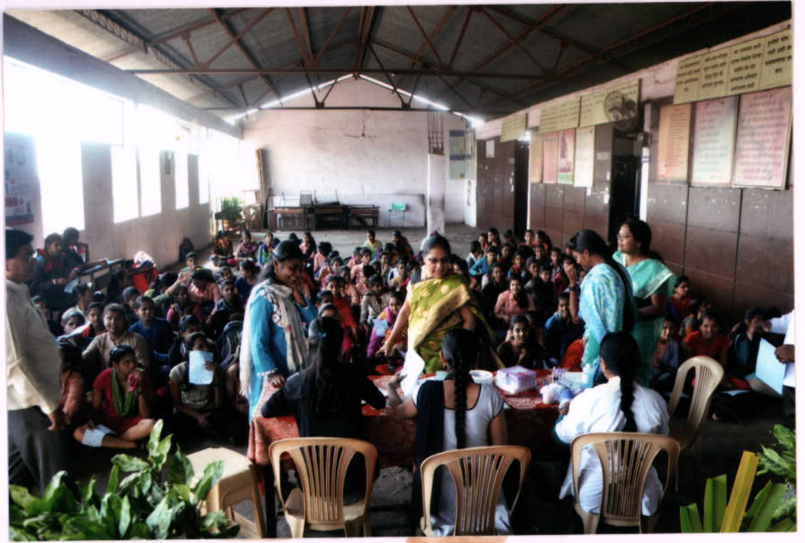
उपस्थित सर्व विद्यार्थिनी व स्टाफ