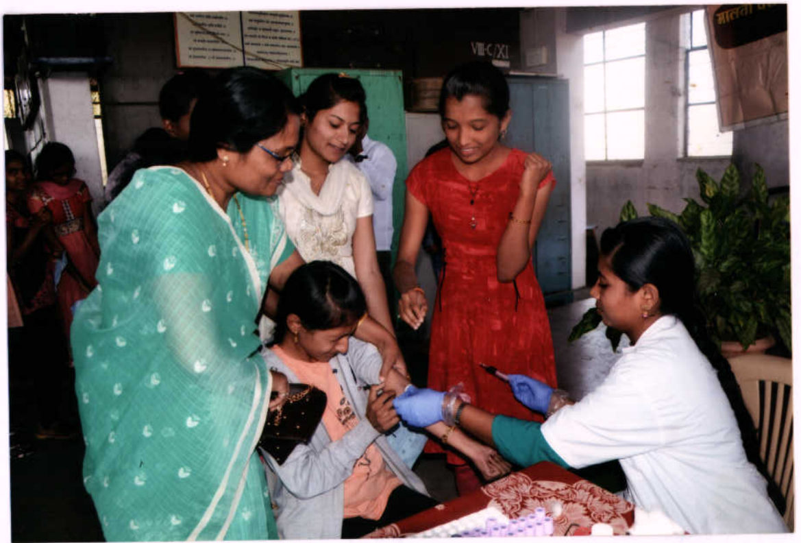
दमड चेकअप करताना सौ जाधव व विद्यार्थिनी